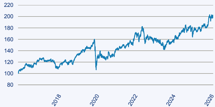
— First Sentier Global Listed Infrastructure Fund I (Accumulation) EUR

Risiko: Die in der Vergangenheit erzielte Performance und die Erträge lassen keinen Rückschluss auf die zukünftige Performance und die Erträge des Fonds zu. Der Fonds ist weder mit einer Garantie noch mit einem Kapitalschutzmechanismus ausgestattet. Der in Euro umgerechnete Wert internationaler Anlagen des Fonds kann infolge von Wechselkursschwankungen (Währungsschwankungen) sowohl steigen als auch sinken. Der Wert des Fonds und damit der Wert ihres Investments kann gegenüber dem Einstandspreis steigen oder fallen.