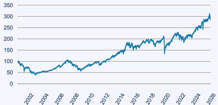
— Invesco Sustainable Pan European Systematic Equity Fund A Acc EUR

Risiko: Die in der Vergangenheit erzielte Performance und die Erträge lassen keinen Rückschluss auf die zukünftige Performance und die Erträge des Fonds zu. Der Fonds ist weder mit einer Garantie noch mit einem Kapitalschutzmechanismus ausgestattet. Der in Euro umgerechnete Wert internationaler Anlagen des Fonds kann infolge von Wechselkursschwankungen (Währungsschwankungen) sowohl steigen als auch sinken. Der Wert des Fonds und damit der Wert ihres Investments kann gegenüber dem Einstandspreis steigen oder fallen.