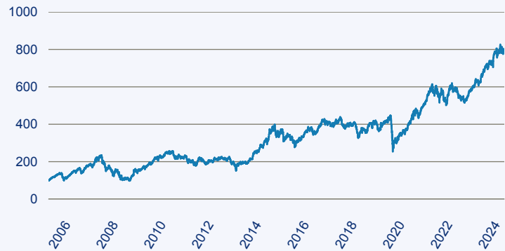
— Franklin India Fund A (acc) EUR

Risiko: Die in der Vergangenheit erzielte Performance und die Erträge lassen keinen Rückschluss auf die zukünftige Performance und die Erträge des Fonds zu. Der Fonds ist weder mit einer Garantie noch mit einem Kapitalschutzmechanismus ausgestattet. Der in Euro umgerechnete Wert internationaler Anlagen des Fonds kann infolge von Wechselkursschwankungen (Währungsschwankungen) sowohl steigen als auch sinken. Der Wert des Fonds und damit der Wert ihres Investments kann gegenüber dem Einstandspreis steigen oder fallen.