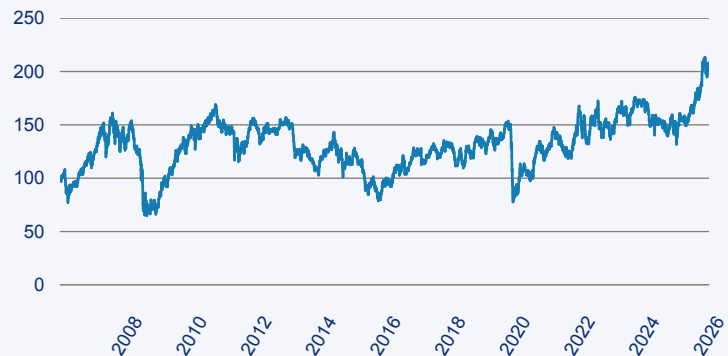
— Schroder ISF Latin American EUR A Acc

Risiko: Die in der Vergangenheit erzielte Performance und die Ertrage lassen keinen Ruckschluss auf die zukunftige Performance und die Ertrage des Fonds zu. Der Fonds ist weder mit einer Garantie noch mit einem Kapitalschutzmechanismus ausgestattet. Der in Euro umgerechnete Wert internationaler Anlagen des Fonds kann infolge von Wechselkursschwankungen (Wahrungsschwankungen) sowohl steigen als auch sinken. Der Wert des Fonds und damit der Wert ihres Investments kann gegenuber dem Einstandspreis steigen oder fallen.