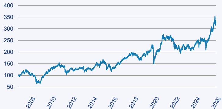
— SCHRODER ISF Global Emerging Markets Opportunities

Risiko: Die in der Vergangenheit erzielte Performance und die Erträge lassen keinen Rückschluss auf die zukünftige Performance und die Erträge des Fonds zu. Der Fonds ist weder mit einer Garantie noch mit einem Kapitalschutzmechanismus ausgestattet. Der in Euro umgerechnete Wert internationaler Anlagen des Fonds kann infolge von Wechselkursschwankungen (Währungsschwankungen) sowohl steigen als auch sinken. Der Wert des Fonds und damit der Wert ihres Investments kann gegenüber dem Einstandspreis steigen oder fallen.