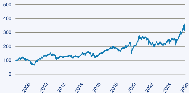
— SCHRODER ISF Global Emerging Markets Opportunities

Risiko: Die in der Vergangenheit erzielte Performance und die Erträge lassen keinen Rückschluss auf die zukünftige Performance und die Erträge des Fonds zu. Der Fonds ist weder mit einer Garantie noch mit einem Kapitalschutzmechanismus ausgestattet. Der in Euro umgerechnete Wert internationaler Anlagen des Fonds kann infolge von Wechselkursschwankungen (Währungsschwankungen) sowohl steigen als auch sinken. Der Wert des Fonds und damit der Wert ihres Investments kann gegenüber dem Einstandspreis steigen oder fallen.