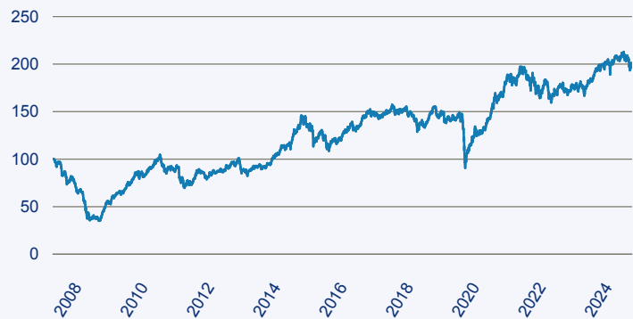
— Templeton Emerging Markets Smaller Companies Fund A (acc) EUR

Risiko: Die in der Vergangenheit erzielte Performance und die Erträge lassen keinen Rückschluss auf die zukünftige Performance und die Erträge des Fonds zu. Der Fonds ist weder mit einer Garantie noch mit einem Kapitalschutzmechanismus ausgestattet. Der in Euro umgerechnete Wert internationaler Anlagen des Fonds kann infolge von Wechselkursschwankungen (Währungsschwankungen) sowohl steigen als auch sinken. Der Wert des Fonds und damit der Wert ihres Investments kann gegenüber dem Einstandspreis steigen oder fallen.