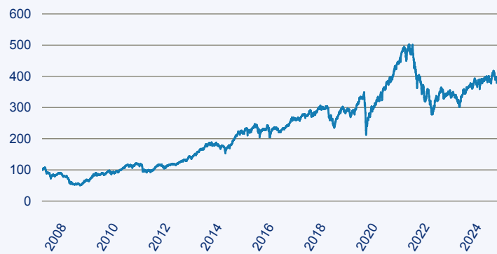
abrnd SICAV II - European Smaller Companies Fund A Acc EUR

Risiko: Die in der Vergangenheit erzielte Performance und die Ertrage lassen keinen Ruckschluss auf die zukunftige Performance und die Ertrage des Fonds zu. Der Fonds ist weder mit einer Garantie noch mit einem Kapitalschutzmechanismus ausgestattet. Der in Euro umgerechnete Wert internationaler Anlagen des Fonds kann infolge von Wechselkursschwankungen (Wahrungsschwankungen) sowohl steigen als auch sinken. Der Wert des Fonds und damit der Wert ihres Investments kann gegenuber dem Einstandspreis steigen oder fallen.