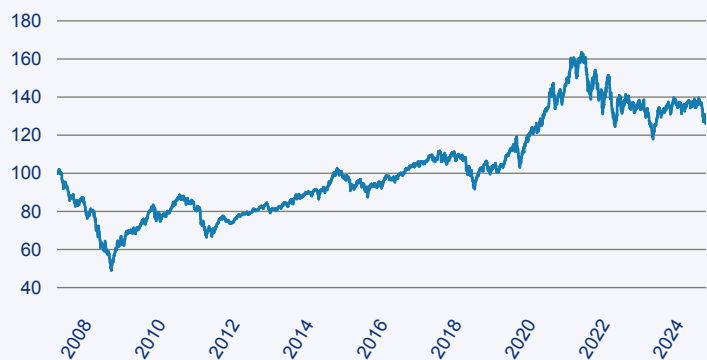
— ACATIS Fair Value Modulor Vermögensverwaltungsfonds Nr. 1 B

Risiko: Die in der Vergangenheit erzielte Performance und die Erträge lassen keinen Rückschluss auf die zukünftige Performance und die Erträge des Fonds zu. Der Fonds ist weder mit einer Garantie noch mit einem Kapitalschutzmechanismus ausgestattet. Der in Euro umgerechnete Wert internationaler Anlagen des Fonds kann infolge von Wechselkursschwankungen (Währungsschwankungen) sowohl steigen als auch sinken. Der Wert des Fonds und damit der Wert ihres Investments kann gegenüber dem Einstandspreis steigen oder fallen.