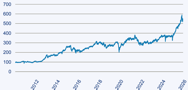
abrdrn SICAV I - Japanese Smaller Companies Sustainable Equity A Acc Hedged E

Risiko: Die in der Vergangenheit erzielte Performance und die Erträge lassen keinen Rückschluss auf die zukünftige Performance und die Erträge des Fonds zu. Der Fonds ist weder mit einer Garantie noch mit einem Kapitalschutzmechanismus ausgestattet. Der in Euro umgerechnete Wert internationaler Anlagen des Fonds kann infolge von Wechselkursschwankungen (Währungsschwankungen) sowohl steigen als auch sinken. Der Wert des Fonds und damit der Wert ihres Investments kann gegenüber dem Einstandspreis steigen oder fallen.