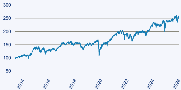
— Janus Henderson Horizon Fund - Pan European Mid and Large Cap Fund A2 EUR

Risiko: Die in der Vergangenheit erzielte Performance und die Erträge lassen keinen Rückschluss auf die zukünftige Performance und die Erträge des Fonds zu. Der Fonds ist weder mit einer Garantie noch mit einem Kapitalschutzmechanismus ausgestattet. Der in Euro umgerechnete Wert internationaler Anlagen des Fonds kann infolge von Wechselkursschwankungen (Währungsschwankungen) sowohl steigen als auch sinken. Der Wert des Fonds und damit der Wert ihres Investments kann gegenüber dem Einstandspreis steigen oder fallen.