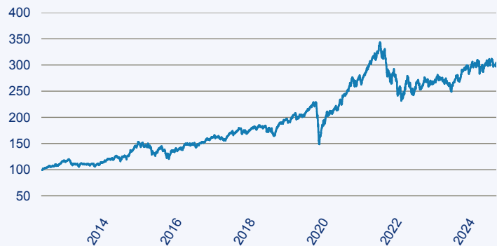
— abrdrn SICAV I - Global Small & Mid-Cap SDG Horizons Equity Fund A Acc EU

Risiko: Die in der Vergangenheit erzielte Performance und die Ertrage lassen keinen Ruckschluss auf die zukunftige Performance und die Ertrage des Fonds zu. Der Fonds ist weder mit einer Garantie noch mit einem Kapitalschutzmechanismus ausgestattet. Der in Euro umgerechnete Wert internationaler Anlagen des Fonds kann infolge von Wechselkursschwankungen (Wahrungsschwankungen) sowohl steigen als auch sinken. Der Wert des Fonds und damit der Wert ihres Investments kann gegenuber dem Einstandspreis steigen oder fallen.