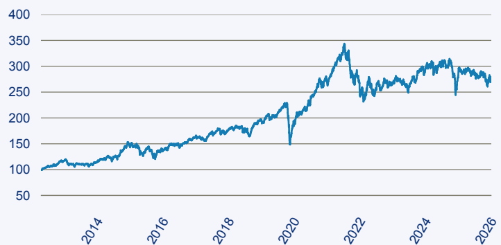
— abrdrn SICAV I - Global Small & Mid-Cap SDG Horizons Equity Fund A Acc EU

Risiko: Die in der Vergangenheit erzielte Performance und die Ertrage lassen keinen Ruckschluss auf die zukunftige Performance und die Ertrage des Fonds zu. Der Fonds ist weder mit einer Garantie noch mit einem Kapitalschutzmechanismus ausgestattet. Der in Euro umgerechnete Wert internationaler Anlagen des Fonds kann infolge von Wechselkursschwankungen (Wahrungsschwankungen) sowohl steigen als auch sinken. Der Wert des Fonds und damit der Wert ihres Investments kann gegenuber dem Einstandspreis steigen oder fallen.