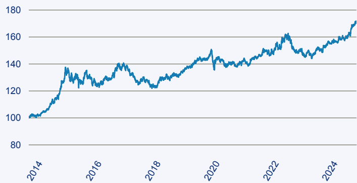
— BGF Fixed Income Global Opportunities Fund A2 EUR

Risiko: Die in der Vergangenheit erzielte Performance und die Erträge lassen keinen Rückschluss auf die zukünftige Performance und die Erträge des Fonds zu. Der Fonds ist weder mit einer Garantie noch mit einem Kapitalschutzmechanismus ausgestattet. Der in Euro umgerechnete Wert internationaler Anlagen des Fonds kann infolge von Wechselkursschwankungen (Wahrungsschwankungen) sowohl steigen als auch sinken. Der Wert des Fonds und damit der Wert ihres Investments kann gegenüber dem Einstandspreis steigen oder fallen.