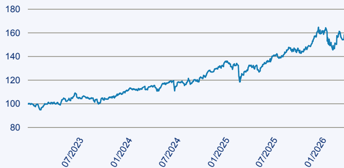
— JPM Middle East, Africa and Emerging Europe Opportunities A Acc EUR

Risiko: Die in der Vergangenheit erzielte Performance und die Erträge lassen keinen Rückschluss auf die zukünftige Performance und die Erträge des Fonds zu. Der Fonds ist weder mit einer Garantie noch mit einem Kapitalschutzmechanismus ausgestattet. Der in Euro umgerechnete Wert internationaler Anlagen des Fonds kann infolge von Wechselkursschwankungen (Währungsschwankungen) sowohl steigen als auch sinken. Der Wert des Fonds und damit der Wert ihres Investments kann gegenüber dem Einstandspreis steigen oder fallen.