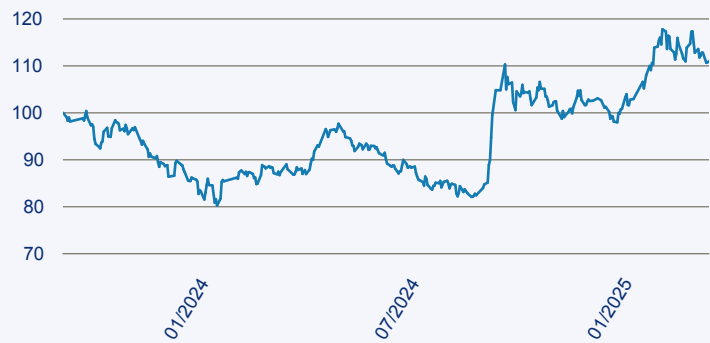
— abrdn SICAV I - All China Sustainable Equity Fund A Acc EUR

Risiko: Die in der Vergangenheit erzielte Performance und die Erträge lassen keinen Rückschluss auf die zukünftige Performance und die Erträge des Fonds zu. Der Fonds ist weder mit einer Garantie noch mit einem Kapitalschutzmechanismus ausgestattet. Der in Euro umgerechnete Wert internationaler Anlagen des Fonds kann infolge von Wechselkursschwankungen (Währungsschwankungen) sowohl steigen als auch sinken. Der Wert des Fonds und damit der Wert ihres Investments kann gegenüber dem Einstandspreis steigen oder fallen.